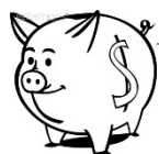
私校退撫儲金(新制)-自主投資 114年度1月~6月期間報酬率

3. 資料來源：財團法人中華民國私立學校教職員退休撫卹離職資遣儲金管理委員會網站公告資料。